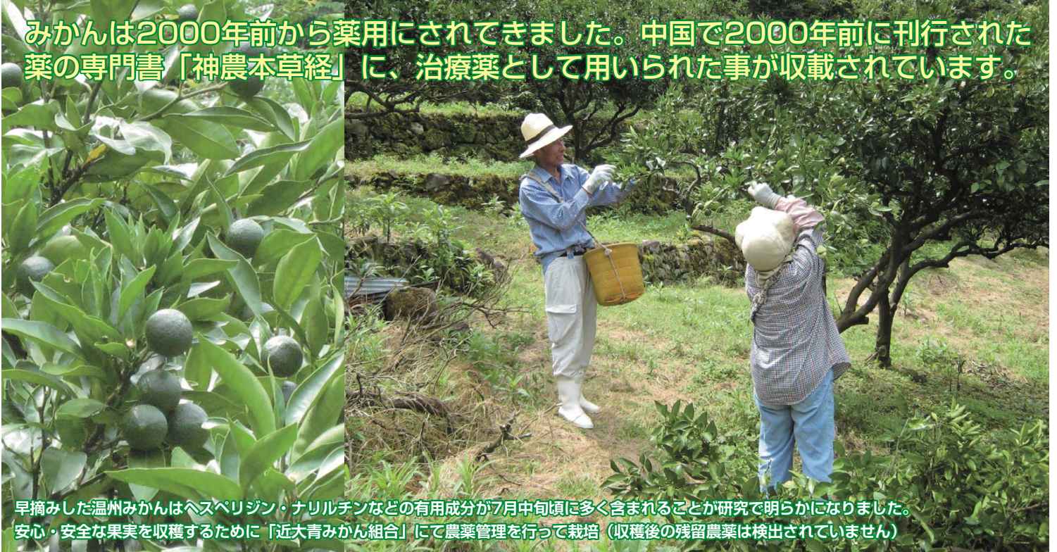
早摘みした温州みかんはヘスペリジン・ナリルチンなどの有用成分が7月中旬頃に多く含まれることが研究で明らかになりました。安心・安全な果実を収穫するために「近大青みかん組合」にて農業管理を行って栽培（収穫後の残留農薬は検出されていません）

みかんは2000年前から薬用にされてきました。中国で2000年前に刊行された薬の専門書「神農本草経」に、治療薬として用いられた事が記載されています。